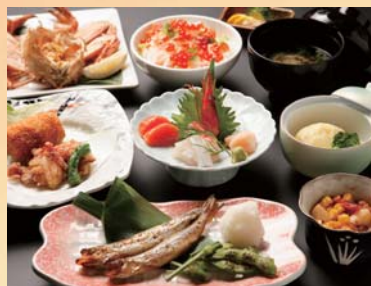
進年会特別コース以外にも、 鍋のない通常のご宴会コースなど、 ご用意しております。