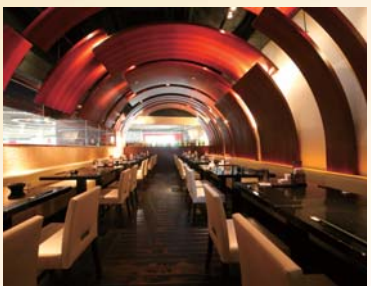
最大40名様までご利用可能な 団体個室にもなるテーブル席。 大人数様にも最適です。