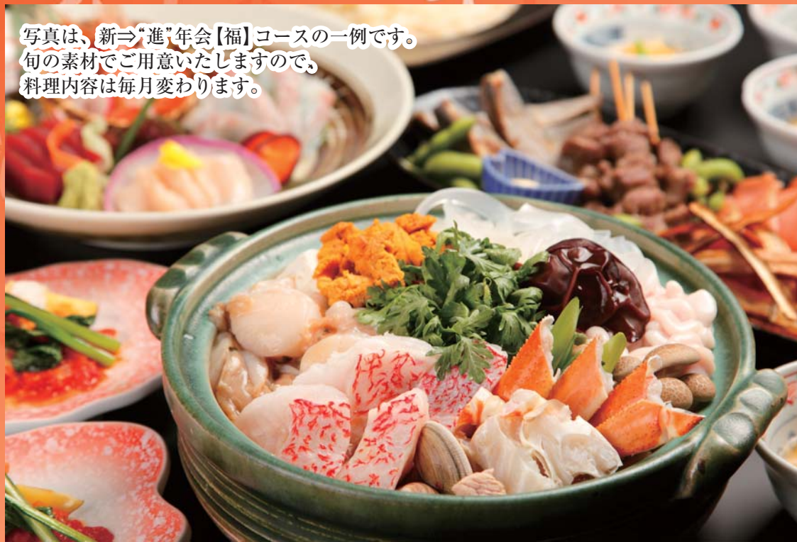
写真は、新⇒「進」年会【福】コースの一例です。 旬の素材でご用意いたしますので、 料理内容は毎月変わります。

四、五名様から、大人数様まで、幅広くご利用いただけます。 掘りごたつ個室は 八室 、一組 最大二十名様 まで、 最大 四十名様 までご利用可能な、個室テーブル席もご用意。