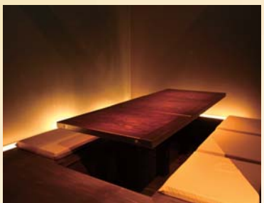
掘りごたつ個室は8室。 一部屋最大6名様まで、 ご利用可能です。