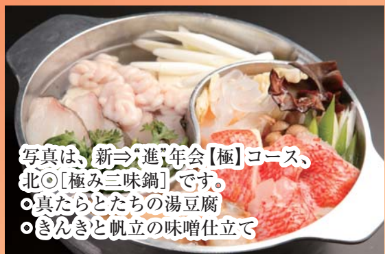
写真は、新⇒「進」年会【極】コース、 北〇【極み三味鍋】です。 〇真たらとたちの湯豆腐 〇きんきと帆立の味噌仕立て