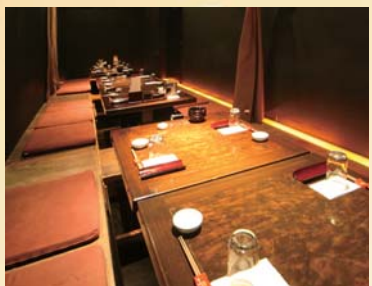
掘りごたつ個室をつなげ、 一組最大20名様まで対応可能。 くつろぎ空間でゆったりと。